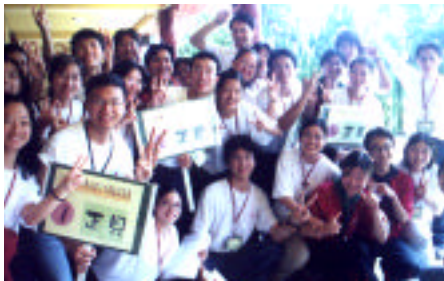
活潑熱情的青年幹訓營學員 Dynamic BLIA YAD members

每位青年朋友在快樂、輕鬆活潑的氣氛下，學習到如何充實自己及如何帶領小朋友的方向及技巧。依法師勉勵青年朋友們要以菩薩的精神實踐人間佛教，以青年的熱心、有擔當、有抱負、肯吃苦的特質開創佛教的未來。此次活動讓大家更深入了解人間佛教的意義及實踐，不但如此，也為紐澤西及波士頓等青年籌備會提供成立青年會的示範。